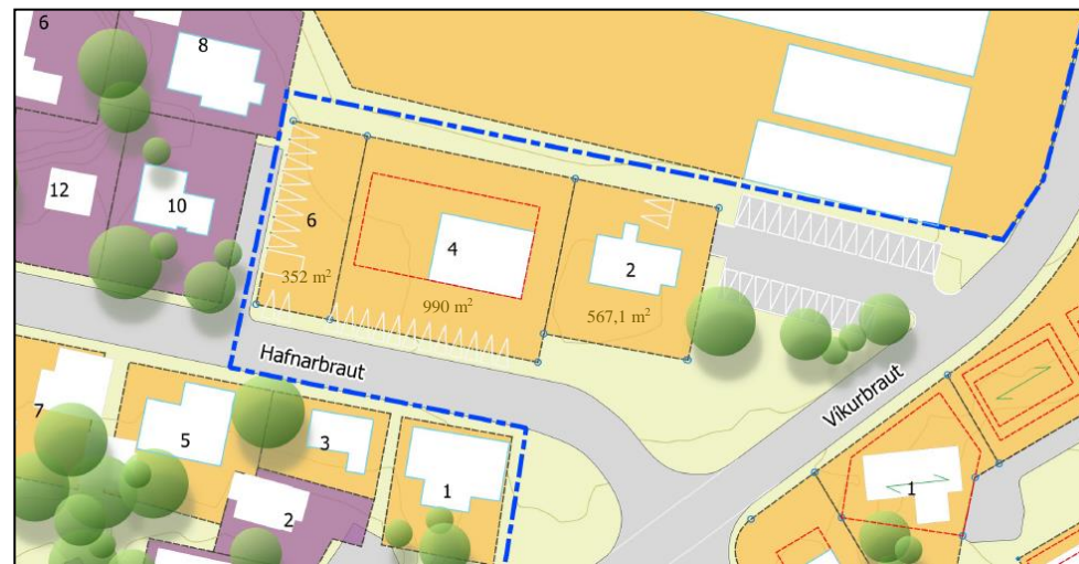
Uppdráttur eftir breytingar mkv. 1:1500